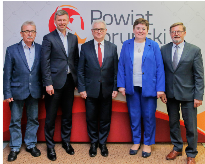
ZARZĄD POWIATU TORUŃSKIEGO VI kadencji

MO: W ogólnopolskim zestawieniu za rok 2023 zajęliśmy czwarte miejsce, rok temu zdobyliśmy srebrny medal, a dwa lata temu brązowy i od 2018 r. zawsze jesteśmy w pierwszej szóstce w kategorii „Powiaty od 60 do