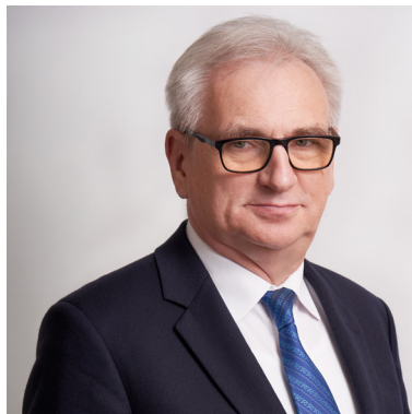
STAROSTA TORUŃSKI MAREK OLSZEWSKI

Największe inwestycje w historii, akcje społeczne integrujące mieszkańców oraz przełomowe rozwiązania dot. transportu zbiorowego, czy współpracy z gminami to sukcesy władz samorządowych Powiatu Toruńskiego VI kadencji. Starosta Marek Olszewski podsumowuje ostatnie 5 lat.