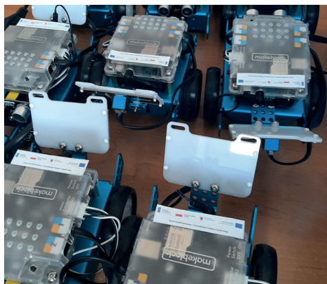
EU-geniusz wyposażał szkoły w 486 programowalnych robotów

– Dawno, dawno temu, za górami, za lasami... Jednak, jak się okazało, całkiem blisko nas i to całkiem niedawno, miało miejsce pewne projektowe wydarzenie. W naszych szkołach pojawił się nowy superbohater – EU-geniusz. Jego pierwszą misją była szkoła tajemnic. W trakcie drugiej misji zagubił się w naukowym labiryncie. Wyjście było tylko jedno i EU-geniusz pewnym krokiem wkroczył w świat 3D. W tym świecie krąży nieprzerwanie od maja 2019 roku i w trakcie tej przygody odkrył wraz z uczniami niejedną tajemnicę. W projekcie „EU-geniusz w świecie 3D” udział wzięło ponad 3 300 uczniów, którzy skorzystali do tej pory