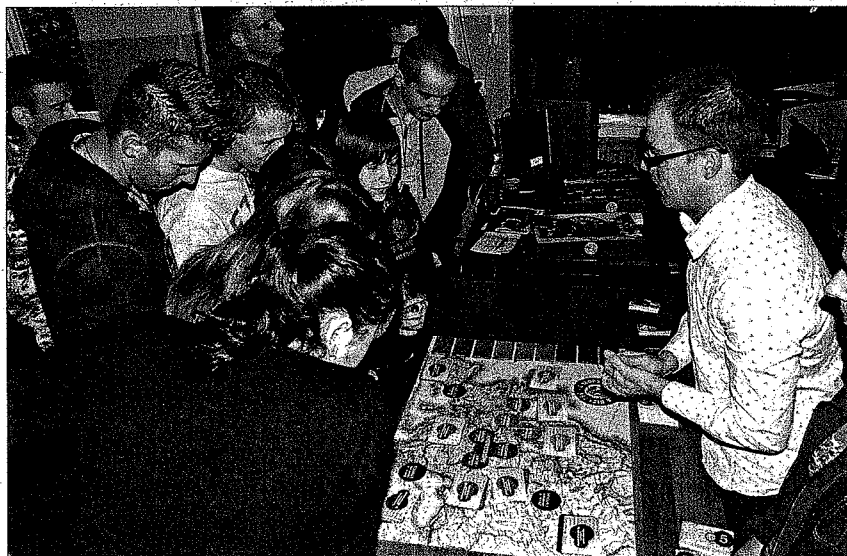
Uczestnicy zajęć z przedsiębiorczości wzięli udział w „Chłopskiej Szkole Biznesu”. Gracze wcielali się w role tkaczy, kowali, piekarzy i brali udział w symulacji rzeczywistych mechanizmów rynkowych